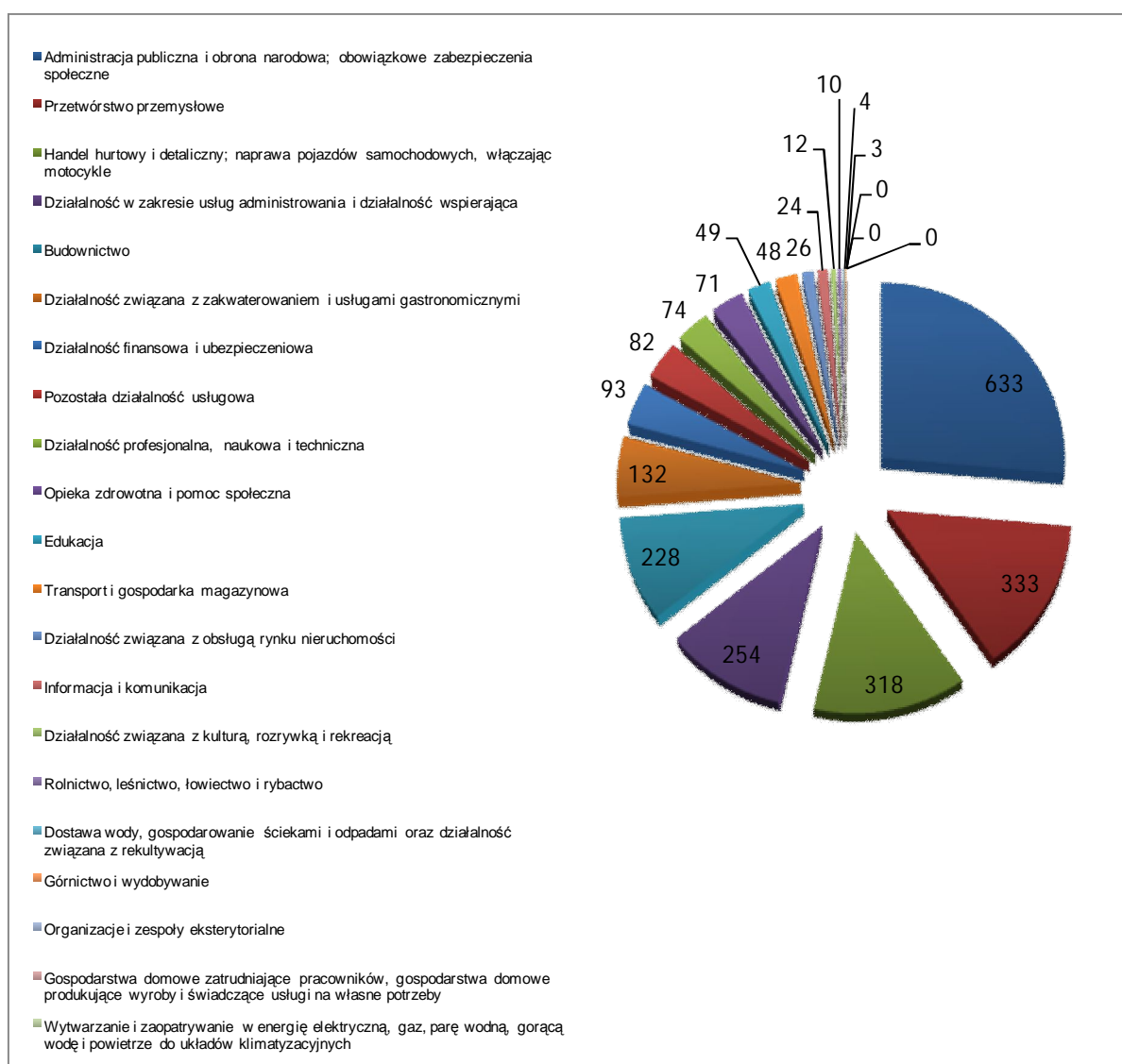
Wykres 2. Liczba ofert pracy zgłoszonych w I połowie 2010 r.