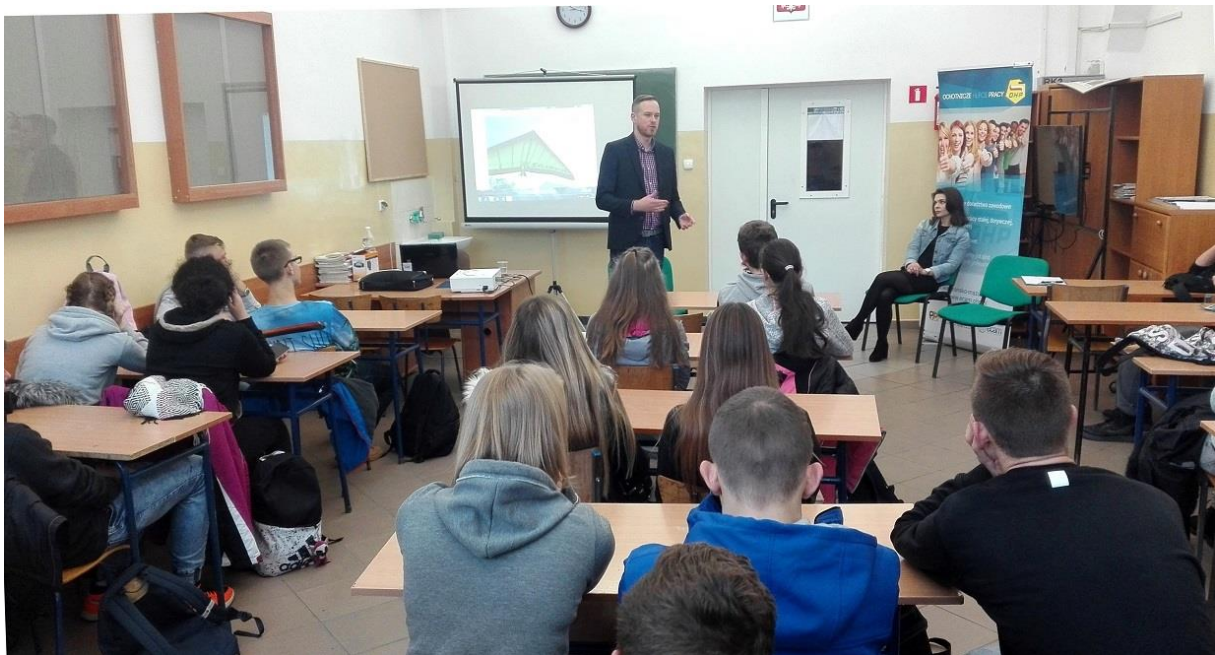
Autor zdjęcia: Marta Buczyńska – doradca zawodowy MCK OHP Giżycko