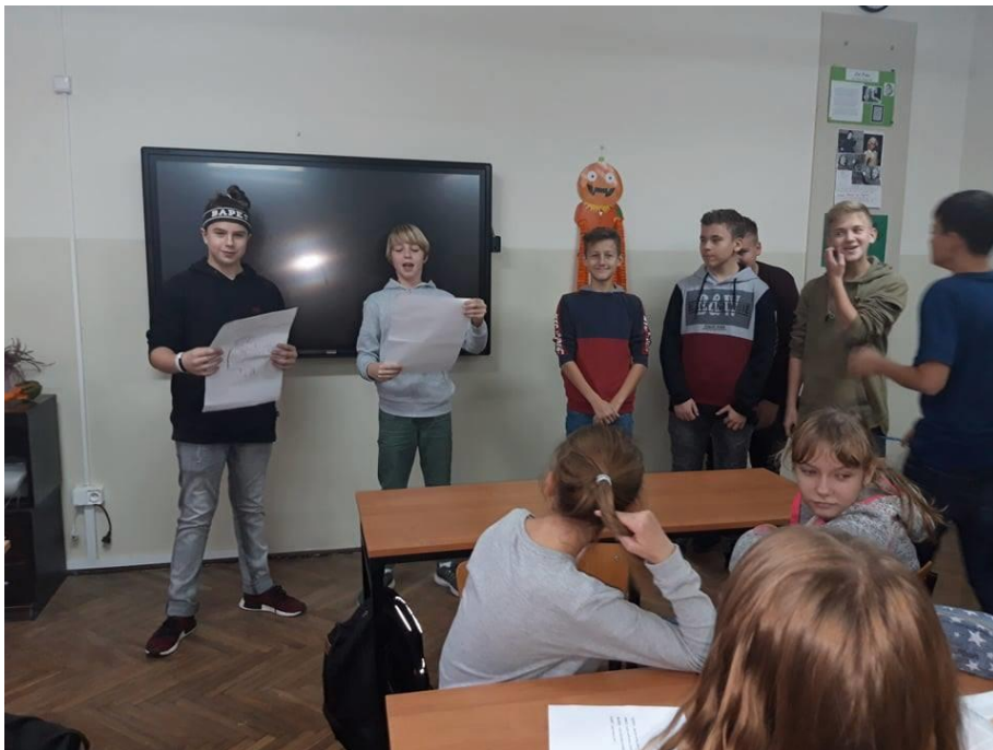
Autor zdjęcia: Daria Siurnicka – doradca zawodowy MCK OHP Szczytno