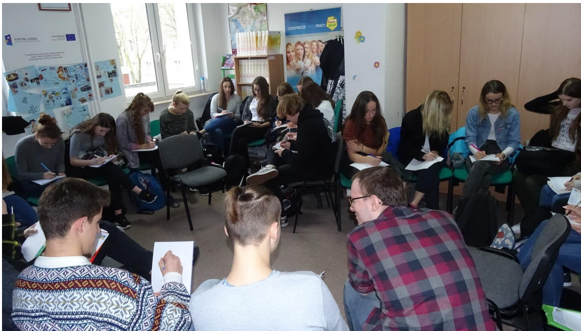
Autor zdjęcia: Beata Różańska – doradca zawodowy MCK OHP Elk